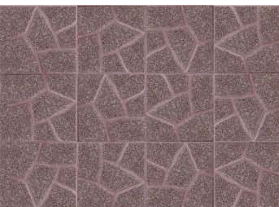
Simil Porfido Levigato Rosso Art. 21