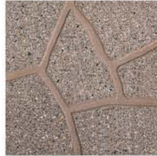
Art. 33 > cm 40 x 40 x 3,8 c.a. Peso 80 kg/m 2 SIMIL PORFIDO LEVIGATO CUOIO