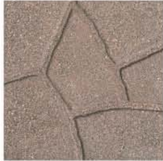
Art. 17 > cm 40 x 40 x 3,8 c.a. Peso 80 kg/m 2 SIMIL PORFIDO SABBIAATO CUOIO