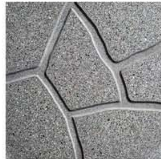
Art. 30 > cm 40 x 40 x 3,8 c.a. Peso 80 kg/m 2 SIMIL PORFIDO LEVIGATO GRIGIO