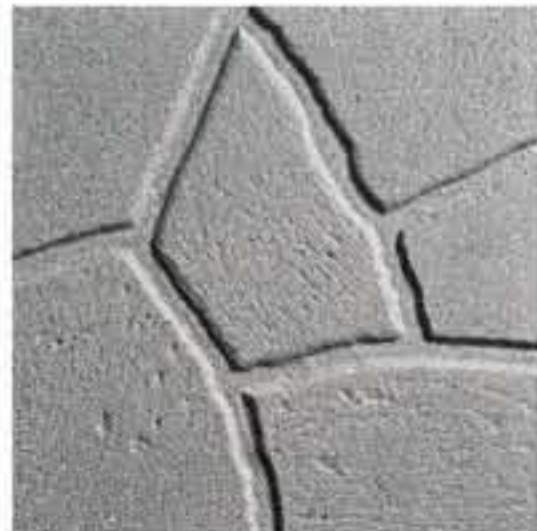
Art. 4 > cm 40 x 40 x 3,8 c.a. Peso 80 kg/m 2 SIMIL PORFIDO SABBIAATO GRIGIO

Polvere di marmo, cemento, granulati di porfidi e pietre dure accuratamente selezionate.