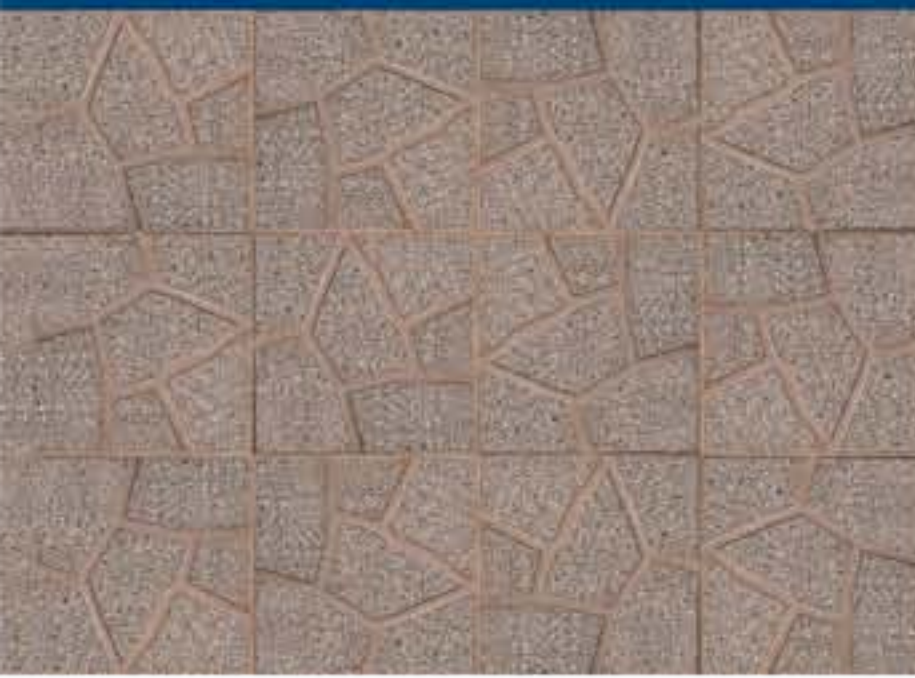
Simil Porfido Levigato Cuoio Art. 33