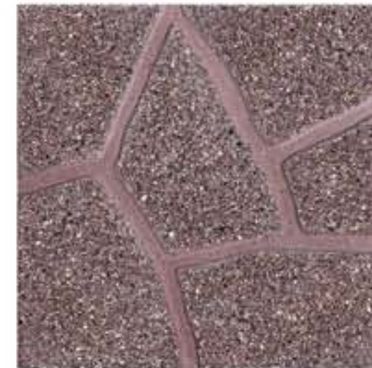
Art. 21 > cm 40 x 40 x 3,8 c.a. Peso 80 kg/m 2 SIMIL PORFIDO LEVIGATO ROSSO