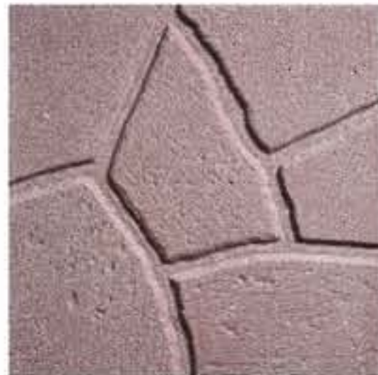
Art. 7 > cm 40 x 40 x 3,8 c.a. Peso 80 kg/m 2 SIMIL PORFIDO SABBIAATO ROSSO