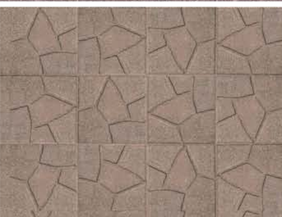
Simil Porfido Sabbiato Cuoio Art. 17